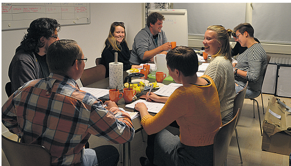
SÖU:s styrelse sammankom till åtta möten under året.